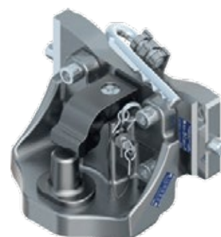
Piton Fix závesový systém