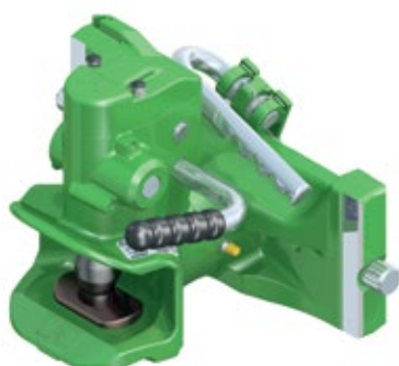
Automatický horný záves s gul'ovým čapom 38 mm