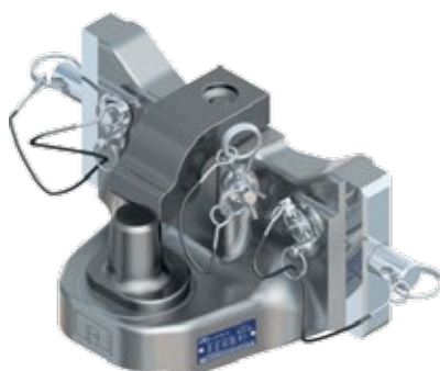
Piton Fix závesový systém