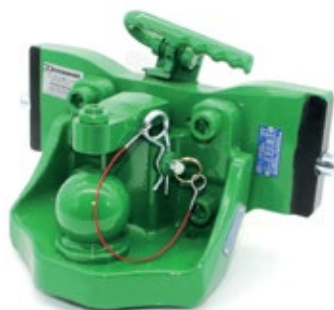
Gul'ový závesový systém K80