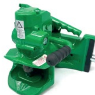
Automatický horný záves s gul'ovým čapom 38 mm