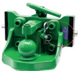
Gul'ový závesový systém K80